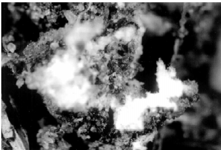
Fot.1. Jaja Porphyrophora polonica (L.) w białym, woskowym mieszku. Phot.1. Eggs of Porphyrophora polonica (L.) within waxy, white cocoon.