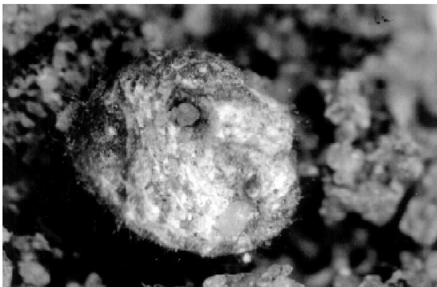
Fot.2. Ciało samicy Porphyrophora polonica (L.) po złożeniu jaj. Phot. 2. Body of a female of Porphyrophora polonica (L.) after oviposition.