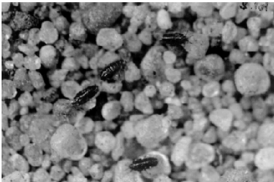
Fot.3. Larwy pierwszego stadium Porphyrophora polonica (L.).

Phot.3. First instar larvae of Porphyrophora polonica (L.).