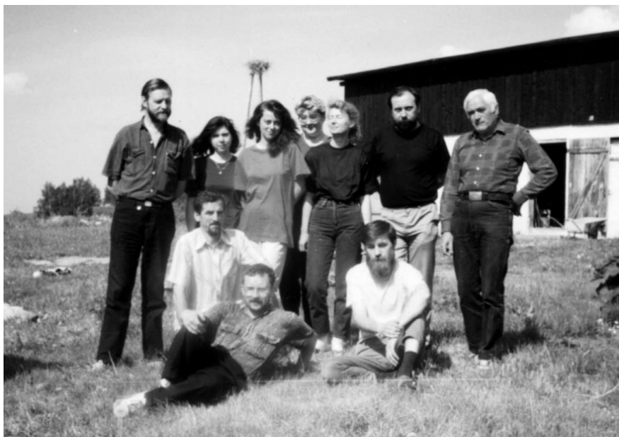
Fot. 1. Pamiątkowe zdjęcie uczestników zjazdu SD PTEnt. w Wysoku nad jeziorem Oświn w 1992 roku