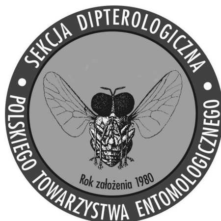
Logo Sekcji Dipterologicznej PTEnt.