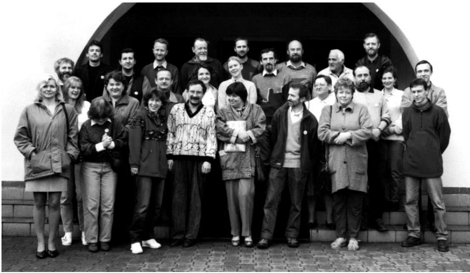
Fot. 3. Uczestnicy XVIII Zjazdu przed budynkiem Hotelu PKP „Zacisze” w Spale w 1999 r.