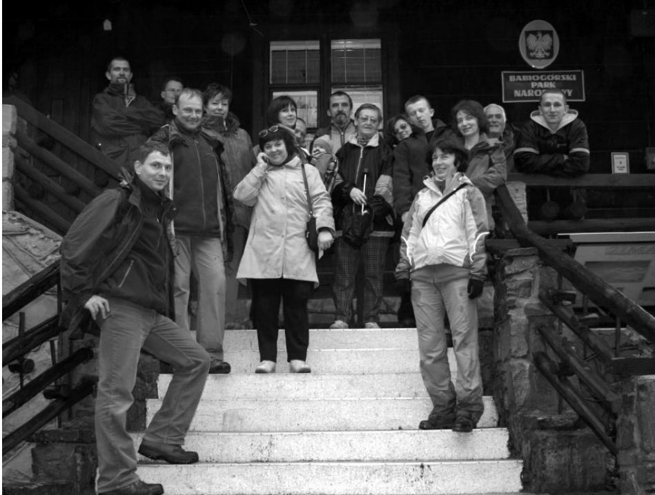
Fot. 5. Uczestnicy XXV Sympozjum Dipterologicznego przed siedzibą Babiogórskiego Parku Narodowego w Zawoi, w 2006 r.

mocy w zdobywaniu i gromadzeniu niezbędnej literatury, gromadzeniu, oznaczaniu i wymianie materiałów naukowych popularyzacji badań dipterologicznych, a także na współpracy z dipterologami za granicą.