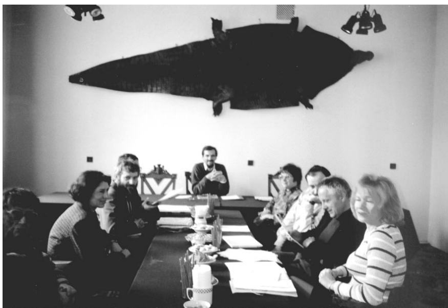
Fot. 2. Obrady Sekcji Dipterologicznej podczas XIV zjazdu w Warszawie na ul. Wilczej w 1995 roku