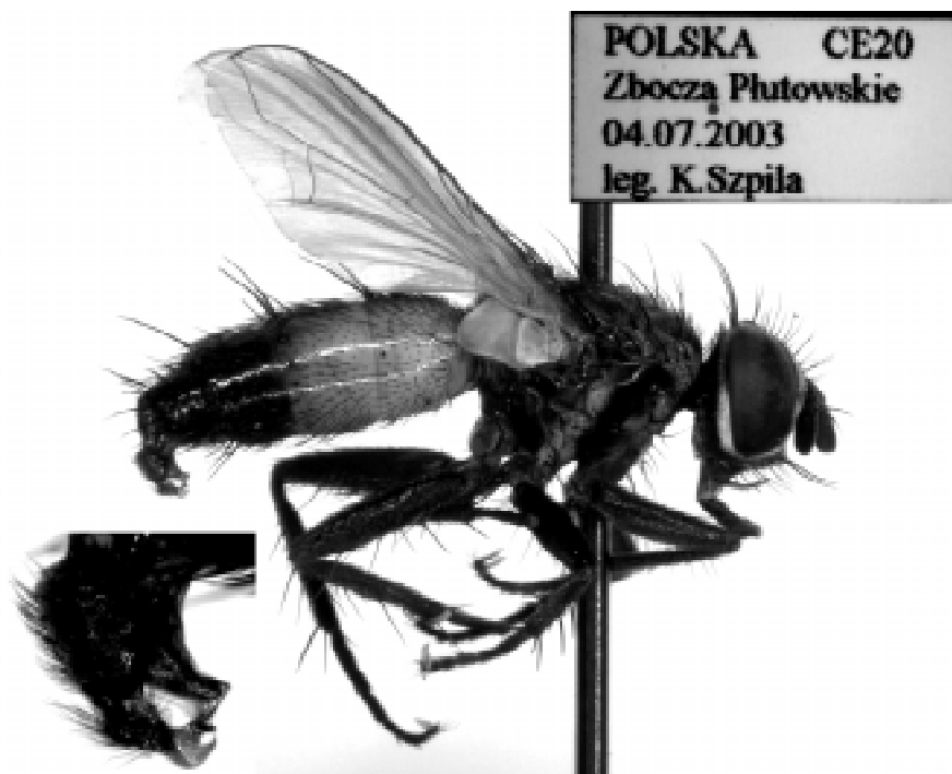
Fot. Samiec Brullaea ocypteroidea R.-D.

Synonimika gatunku Brullaea ocypteroidea ROBINEAU-DESVOIDY, 1863 była w przeszłości obarczona pewnymi błędami. BEZZI (1907) w katalogu Tachinidae z początku XX wieku zsynonimizował rodzaj Clairvillia R.-D. z rodzajem Brullaea R.-D. i podał błędnie, że Brullaea ocypteroidea R.-D., 1863 i Clairvillia ocypteroidea SCHINER, 1862 są synonimami. Gatunek Clairvillia ocypteroidea R-DESV. podał z terenu Polski BOBEK (1893). W swojej pracy