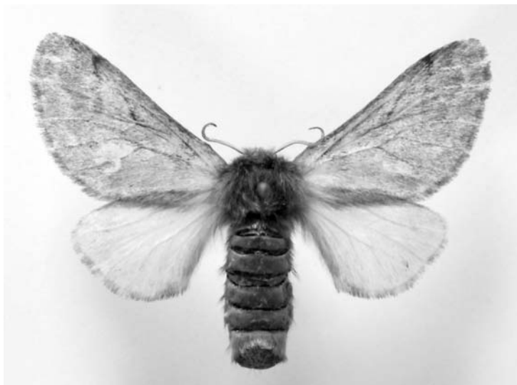
Fot. 4. Thaumetopoea pinivora (TREIT.), samica (38 mm): 2 km na zachód od miejscowości Wilkocin, dawny poligon, 16 VIII 2001, leg. et coll. A. MALKIEWICZ.