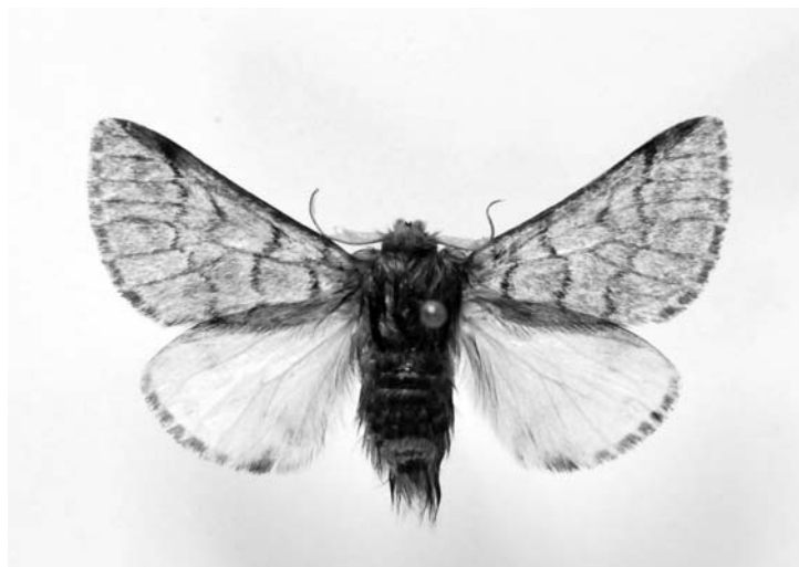
Fot. 3. Thaumetopoea pinivora (TREIT.), samiec (32 mm): Stara Oleszna, 15 VIII 2007, leg. et coll. A. MALKIEWICZ.