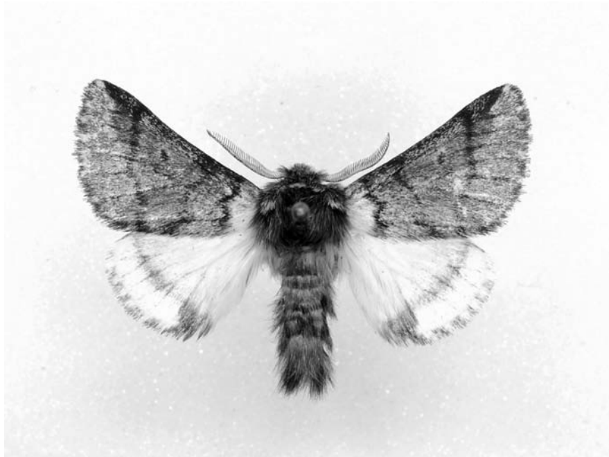
Fot. 1. Thaumetopoea processionea (L.), samiec (rozpiętość skrzydeł 29 mm): rezerwat „Bielinek”, 28 VII 2009, leg. T. BLAIK et M. A. MAZUR, coll. KBUO (fot. M. A. MAZUR)